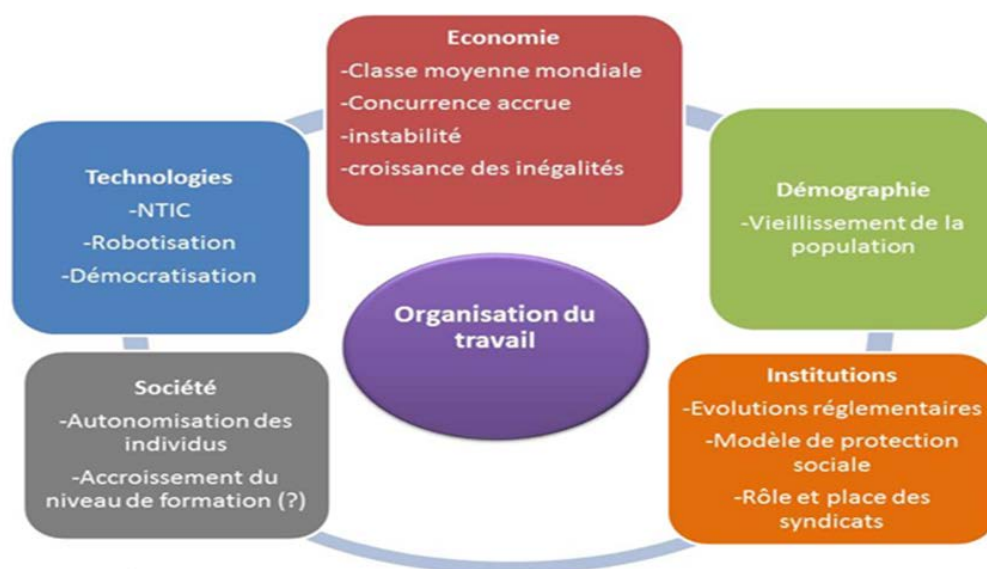
Figure 1 – L'organisation de demain : cinq déterminants

Il faut donc commencer par cerner les contours de cet avenir : quels seront les traits marquants de l'économie mondiale, quels changements technologiques ou sociétaux seront intervenus ? Plusieurs travaux de prospective à l'horizon 2030-2035, menés pour l'Union européenne par ESPAS 44 (European Strategy and Policy Analysis System), pour le président des États-Unis par le National Intelligence Council 45 et pour le gouvernement britannique par la commission Jobs and Skills in 2030 46 dessinent un monde de demain plus volatil et plus complexe qu'aujourd'hui, qui nécessitera des organisations du travail plus souples et plus évolutives, capables d'anticiper les changements, même brutaux.