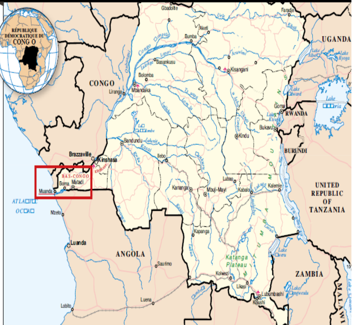
CARTE DE LA RDC ET LOCALISATION DE LA PROVINCE DU BAS-CONGO

Partenaires: Conférence Episcopale pour les ressources naturelles et ADEV