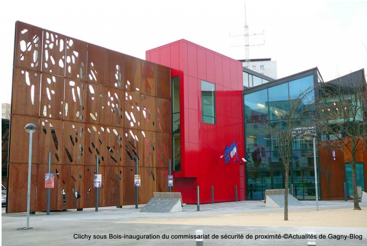
Clichy sous Bois-inauguration du commissariat de sécurité de proximité-©Actualités de Gagny-Blog